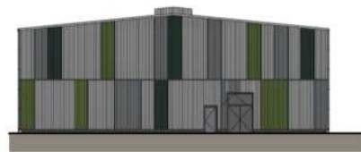
Ostfassade Mst. 1:333

Der Baugrund erfordert es, die Betonbodenplatte auf Pfähle zu fundieren. Die Halle selbst besteht aus einer Holzkonstruktion, welche mit naturfarbenen Elementen aus Stahl verkleidet wird und so in das Landschaftsbild integriert. Auf dem Dach ist zudem eine PV-Anlage vorgesehen.