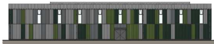
Nordfassade Mst. 1:333