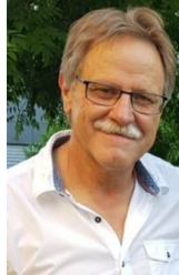
Geri Waltenspühl Kommunikation